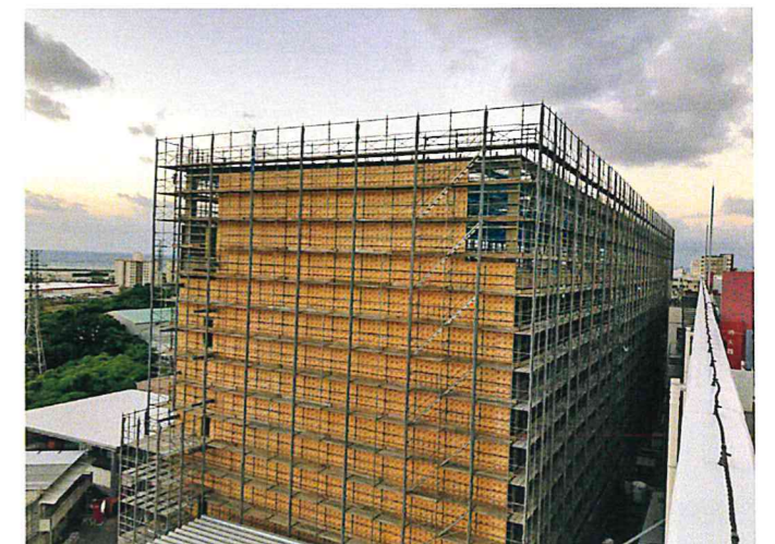
外壁西側断熱材張込状況